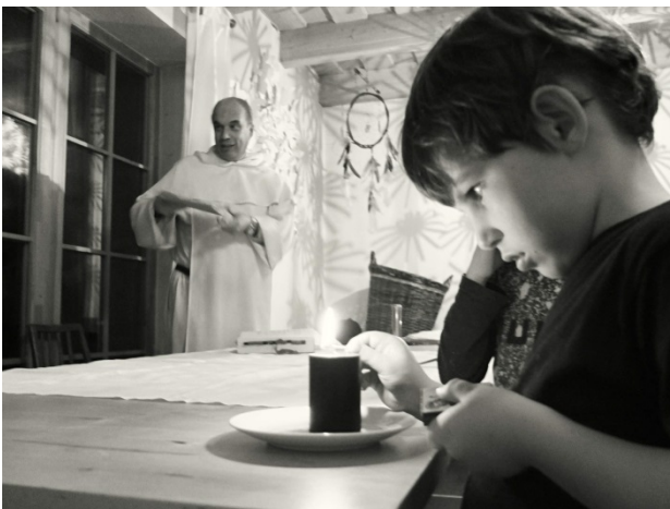
Popeleční středa (putování na Hokkaido) – před mši svatou

Již osmý ročník tábora o jarních prázdninách nás zavedl na putování na Hokkaido. Jelikož nám byly odcizeny letenky japonskou mafií Jakuzou, tak nám nezbývalo než se vydat do Japonska po zemi. První den jsme měli zaměřený na Slovensko (je